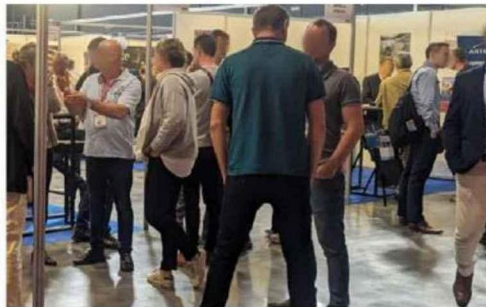
Alpexpo, le salon de l'hydroélectricité à Grenoble, les 8 et 9 octobre 2024

Fort d'une croissance de +20%/ an, ce salon est le rendez-vous des experts en hydroélectricité et innovations EnR au cœur des Alpes, pôle industriel unique en Europe qui concentre toute la chaîne de valeur industrielle. La nouvelle édition se déroulera les 8 et 9 octobre 2024 à Grenoble (38 – Alpexpo) avec l'objectif d'accueillir plus de 170 exposants et 2000 visiteurs !