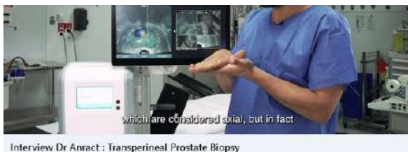
Interview Dr Anract : Transperineal Prostate Biopsy

Koelis noue un partenariat avec Deephealth pour l'interprétation des IRM de la prostate alimentée par l'IA et la guidance dans la biopsie de fusion